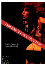
Tableau d'une exécution - de Howard Barker par le Théâtre du Beau fixe 31